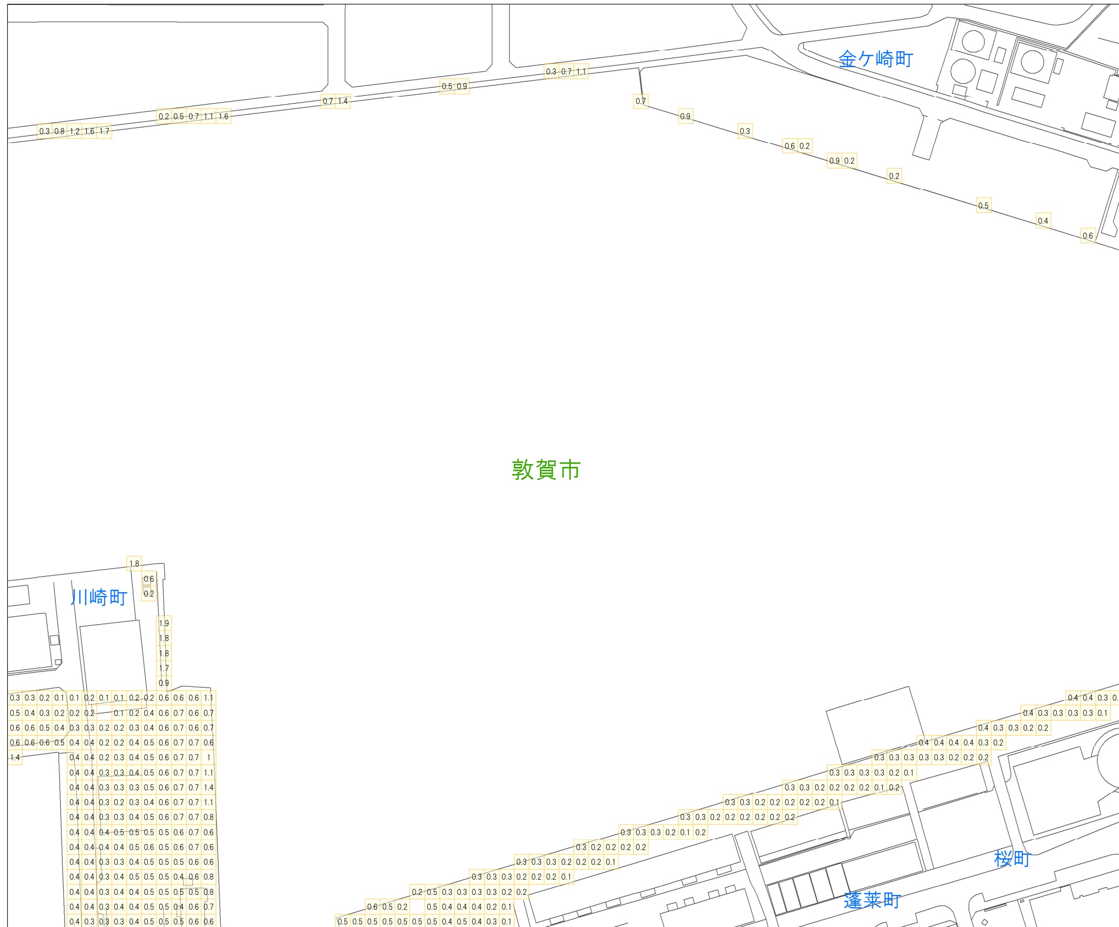
津波災害警戒区域 区域図