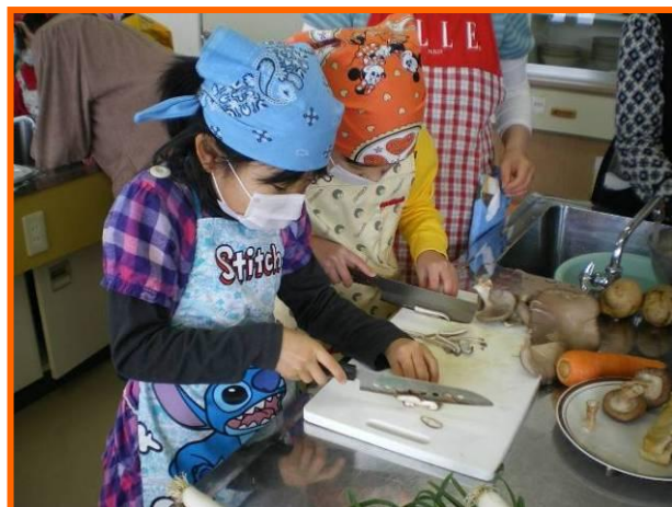
いよいよ調理開始