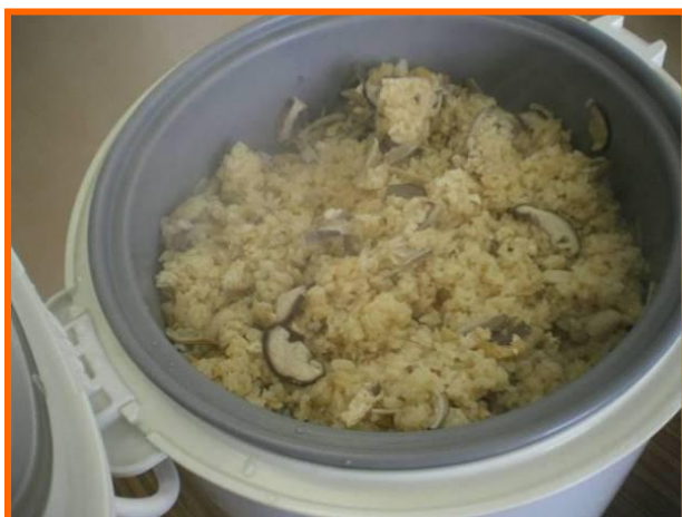
ご飯が炊けました！