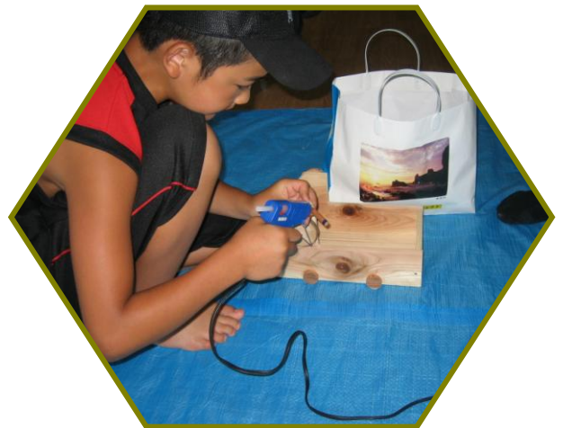
グルーガンを使い飾り付け