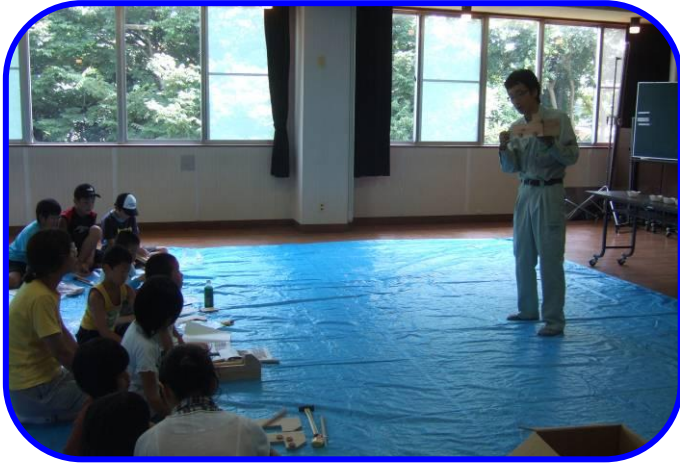
林業普及員による説明

平成22年7月26日（月）、雄島公民館において、木を使い木の良さ知ってもらおうと、親子木工教室を開催しました。