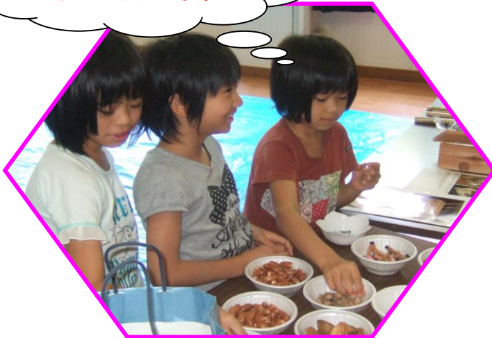
飾り付けの材料選び