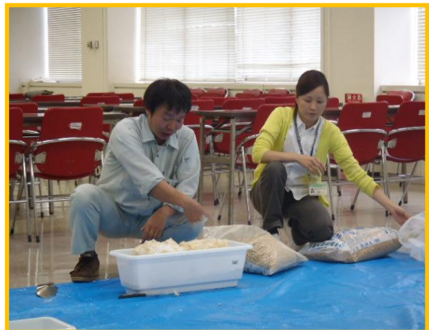
カンタケの伏せ込み方法について説明