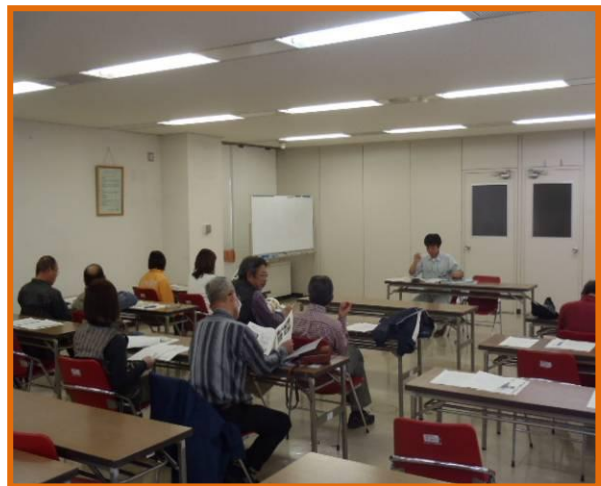
カンタケの栽培方法について説明