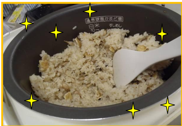
ごはんが炊けました！