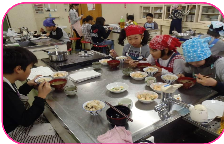
みんなでおいしくいただきました！