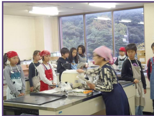
説明を受ける子ども達