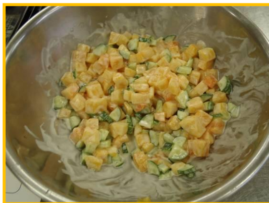
柿とキュウリのサラダ