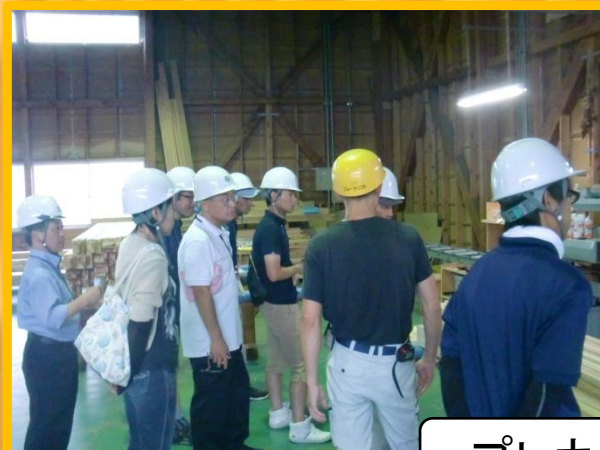
プレカット工場見学