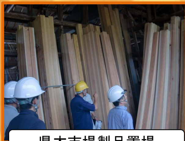
県木市場製品置場