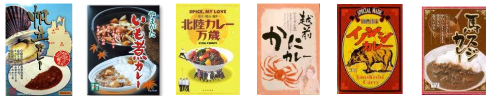
11県のご当地カレーフェア