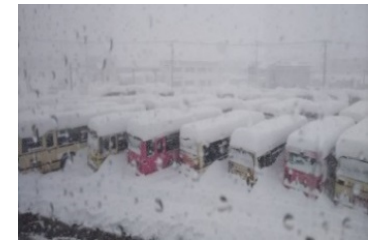
除雪が遅れるバス営業所