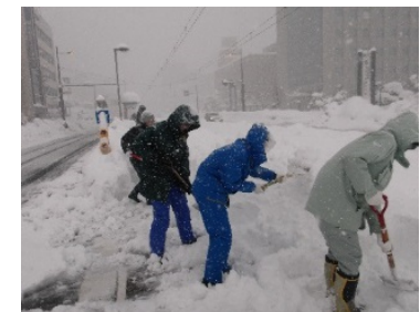
駅を除雪する県職員

踏切 ：えちぜん鉄道 135箇所 福井鉄道 61箇所 駅 ：えちぜん鉄道 44箇所 福井鉄道 25箇所 バス停 ：京福バス 1,000箇所以上 福鉄バス 400箇所以上