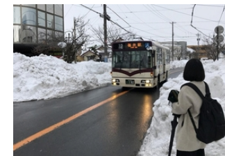
安全確認ができた路線から再開

対応案：交通事業者、県と市町（道路担当課、交通担当課）が最新の気象・運行状況を共有 県や市町から交通事業者に除雪状況（優先再開路線、踏切、軌道等）を提供