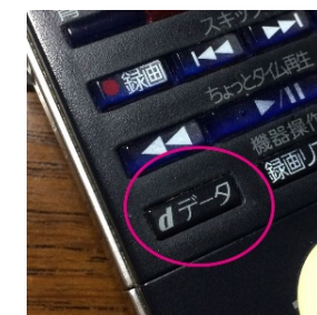
身近なテレビを使い情報を入手

対応案：テレビのdボタンを活用し、パソコンに不慣れな人が情報を入手しやすい方法の導入