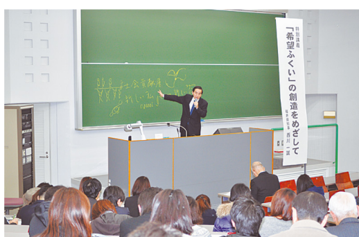
西川知事による福井県立大学での特別講義

テレビ放送番組 2/6(日) 7:30~8:00 FBC「おはようふくい730」 「希望ふくい」の創造に向けて～「福井県民の将来ビジョン」策定～