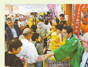
ふるさと知事ネットワーク 農産物直売所交流フェア

人口減少・超高齢時代にふさわしい新しい街づくりや「ふくいの文化」の創造を進め、活気にあふれる「新しいふるさと」をつくります。高速交通網を活用し、国内外とつながる新たなネットワークを築いて人流・物流を活発化します。