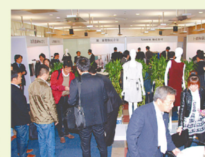
北陸3県繊維産業クラスター協会による上海での展示会

商工業や農林水産業など福井の産業の技術革新と「ふくいの後継者」育成を最優先に進めます。多様なニーズに応える商品開発力とアジア・マーケットへの販売力を強化し、アジアの成長と活力を取り込みながら福井の産業の成長を産み出します。