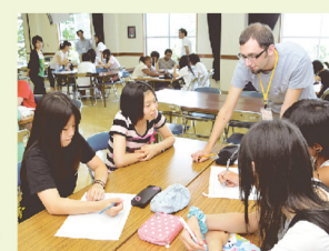
ALTによる高校生英語キャンプ

ふるさとへの誇りと愛着を持ち、「希望」を持ってグローバルな視野で行動する人材を育成します。県民一人ひとりが行動力を発揮する「県民活躍社会」を創出し、時代の転換期をリードします。