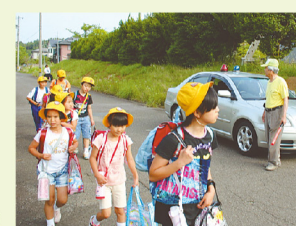
地域で見守る子ども安心県民作戦

福井に残る「家族や地域のつながり」、「人と人の新しい縁」を活かし育てることによって、子育て、高齢者福祉、地域の安全・安心を地域ぐるみで応援します。日本やアジアの先進モデルとなる地域社会を実現します。