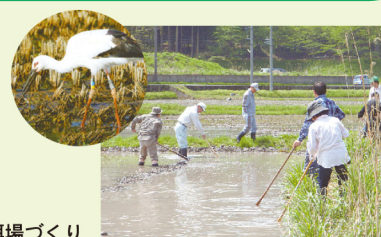
コウノトリの餌場づくり

福井の海・山・里・川など豊かな「自然資本」を守り育て、ふるさとの景観を維持・改善し、美しい「福井の風景」を次世代へ継承します。また、最先端となる低炭素の街づくりを進め、アジアのモデルをめざします。