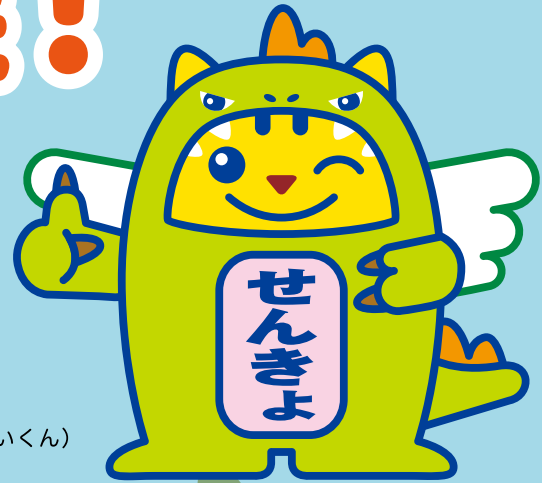
めいすいサウルス (福井県ご当地めいすいくん)

投票への参加と 明るい選挙の推進をテーマとする キャッチフレーズや標語を 募集します。たくさんの応募を お待ちしております。