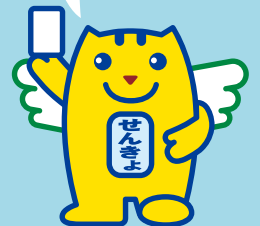
選挙のめいすいくん (明るい選挙のイメージキャラクター)

18歳 選挙権について 日本の未来を担う若い世代の声をより政治に取り入れるため、70年ぶりに法律が改正されて、平成28年7月に行われた参議院議員通常選挙から選挙権年齢が満18歳以上に引き下げられました!