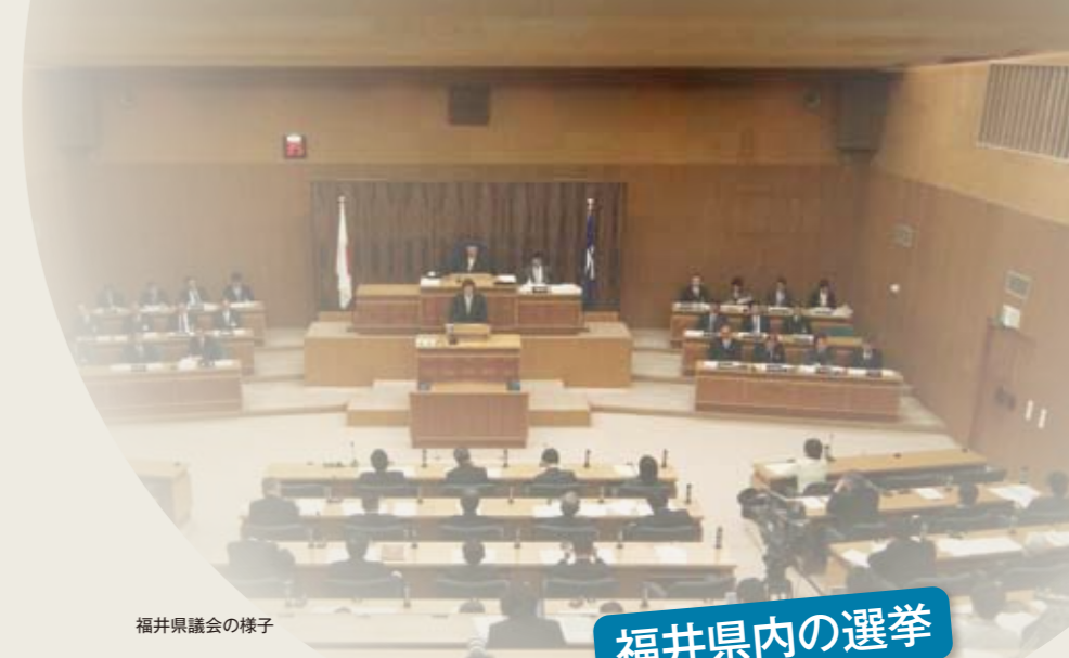
福井県議会の様子

一概に選挙と言っても、対象となる選挙にあわせてその制度もいろいろ。国の選挙(衆議院議員、参議院議員)と福井県内の選挙(県知事、県議会議員、市町長、市町議会議員)に分けて、その仕組みを見ていこう。