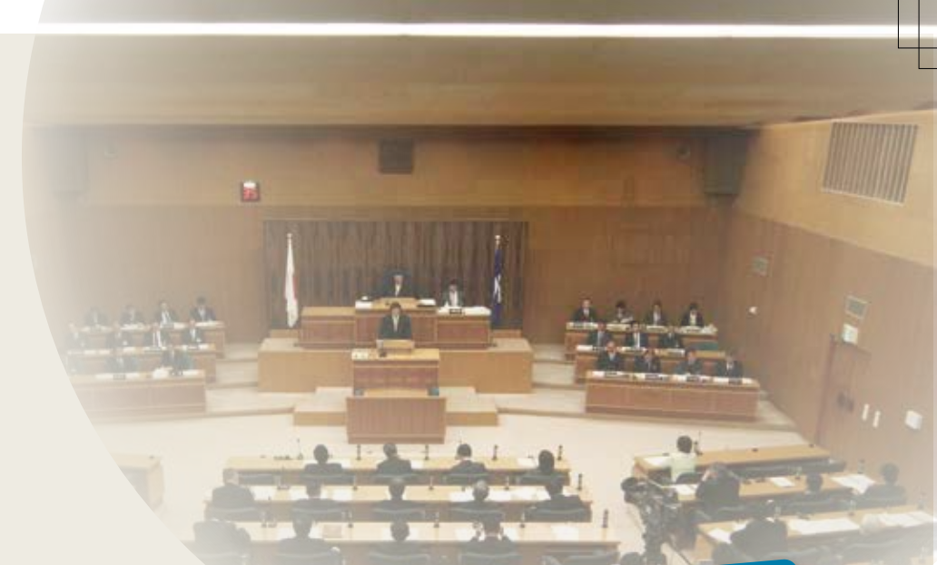
福井県議会の様子

一概に選挙と言っても、対象となる選挙にあわせてその制度もいろいろ。国の選挙(衆議院議員、参議院議員)と福井県内の選挙(県知事、県議会議員、市町長、市町議会議員)に分けて、その仕組みを見ていこう。