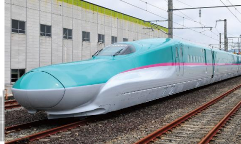
とうほくしんかんせん 東北新幹線 とうきょう しんあもり (東京～新青森) イー ケイ E5系 はやぶさ さいこうじやく 最高時速 320km