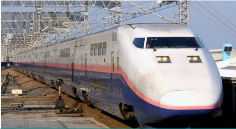
じょうつしんかんせん 上越新幹線 とうきょう にいがた (東京～新潟) イー ケイ マックス E1系Maxとき さいこうじやく 最高時速 240km