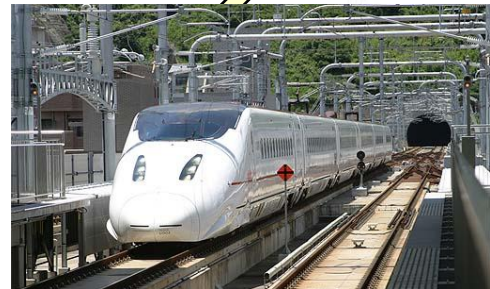
きゅうしゅうしんかんせん 九州新幹線 しんやつしろ かごしまちゅうおう (新八代～鹿児島中央) ケイ 800系 つばめ さいこうじやく 最高速度 260km