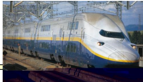
とうほくしんかんせん 東北新幹線 とうきょう せんだい (東京～仙台) イー ケイ マックス E4系Maxやまびこ さいこうじやく 最高時速 240km