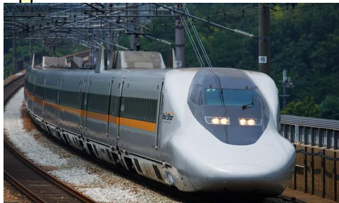
さんやう しんかんせん 山陽新幹線 しんあおさか はかた (新大阪～博多) ケイ 700系 ひかりレールスター さいこうじやく 最高時速 285km

青い線 いきま新幹線が走っているところ 緑の線 いきま線路を作っているところ 赤い線 これから線路をつくることところ