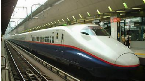
ほくりくしんかんせん 北陸新幹線 とうきょう なかの (東京～長野) イー ケイ E2系 あさま さいこうじやく 最高時速 260km