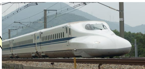
とうかいどう しんかんせん 東海道山陽新幹線 とうきょう はかた (東京～博多) エフ ケイ N700系 のぞみ さいこうじやく 最高時速 300km

きゅうしゅうしんかんせん 九州新幹線 にしきゅうしゅう 西九州ルート はかた ながさき 博多～長崎