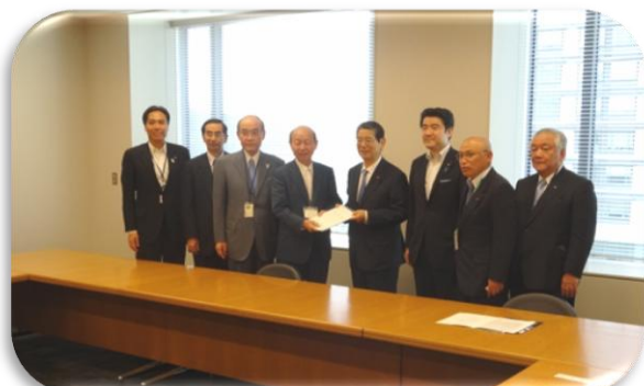
町村自民党整備新幹線等鉄道調査会長への要請