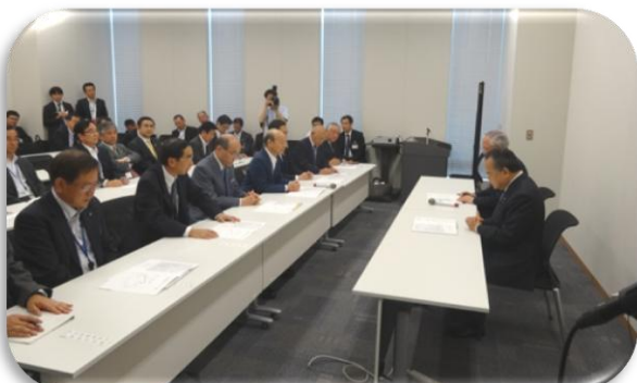
井上公明党幹事長への要請