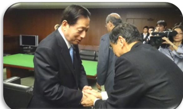
太田国土交通大臣への要請