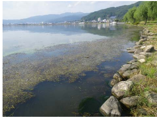
諏訪湖の湖岸の様子

自然護岸再生部会と外来生物等対策部会が合同で、長野県にある諏訪湖を訪問視察しました。諏訪湖での湖岸再生の取組状況やヒシの除去・堆肥化について、諏訪湖の関係者から説明を受け、三方五湖での取組について意見交換をしました。