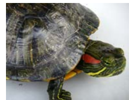
ミシシippiaカミミガメ