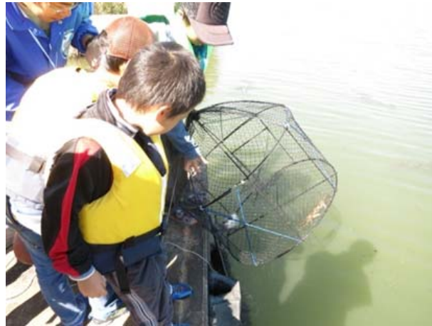
かゴわなの引き揚げ

今回の調査では、外来魚を釣り上げることはできませんでしたが、かゴわなによって、外来種のおオクチバスとウシガエルを捕獲することができました。