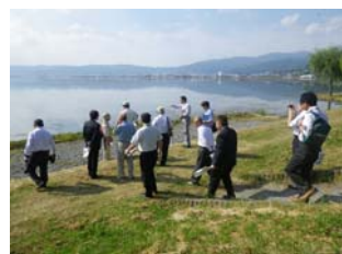
諏訪湖の湖岸やヒシ堆肥化の状況を見学