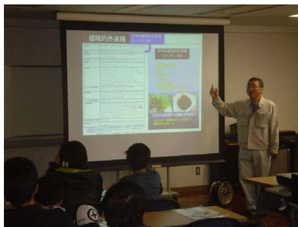
外来魚についての勉強会