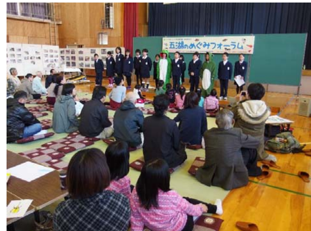
三方小学校5年生の発表の様子

三方小学校5年生による発表では、地元の方にお世話になりながら全校児童で取り組んでいる“ゆりかご水田”における田んぼでフナやコイを育て