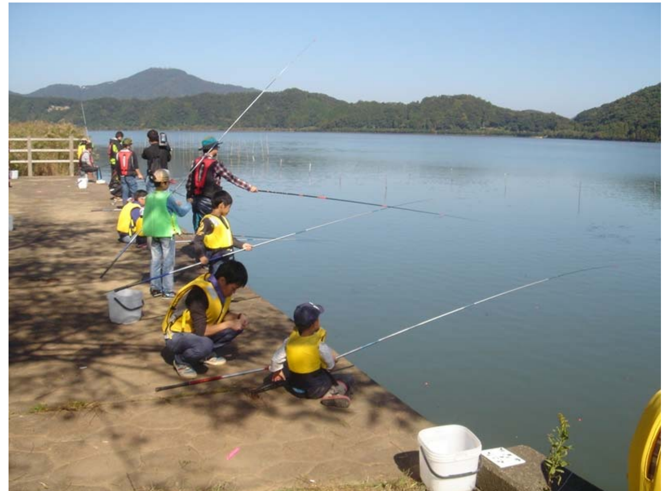
みんなの三方五湖調査（湖のギャング ブラックバス・ブルーギル）