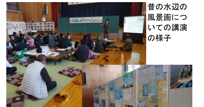
昔の水辺の風景画についての講演の様子

会場内には、ゆりかご水田での取組をまとめた壁新聞や、三方小学校の児童が描いた“昔の水辺の風景画”が展示されました。また、会場の外では、エビと豆のつくだ煮、シジミ汁、ウナギご飯などの試食が振る舞われ、湖のめぐみを味わいました。