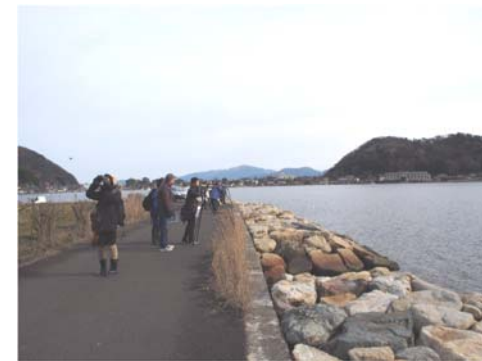
湖畔での野鳥観察