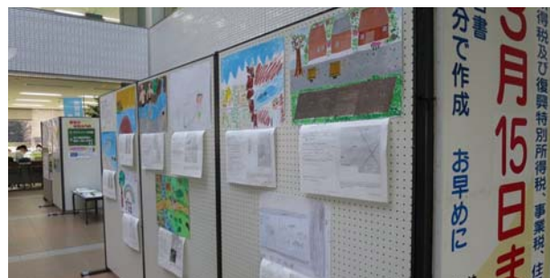
美浜町役場での展示