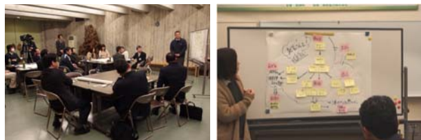
先生方による話し合いと発表