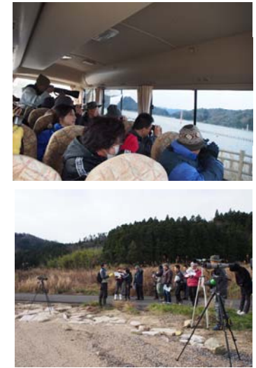
水鳥を驚かさぬようにバスの中からの観察