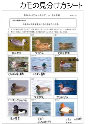
カモの見分け方シート

日本野鳥の会福井県のメンバーにカモ類の見分け方を習いながら、湖面で羽を休める鳥類をじっくり観察しました。