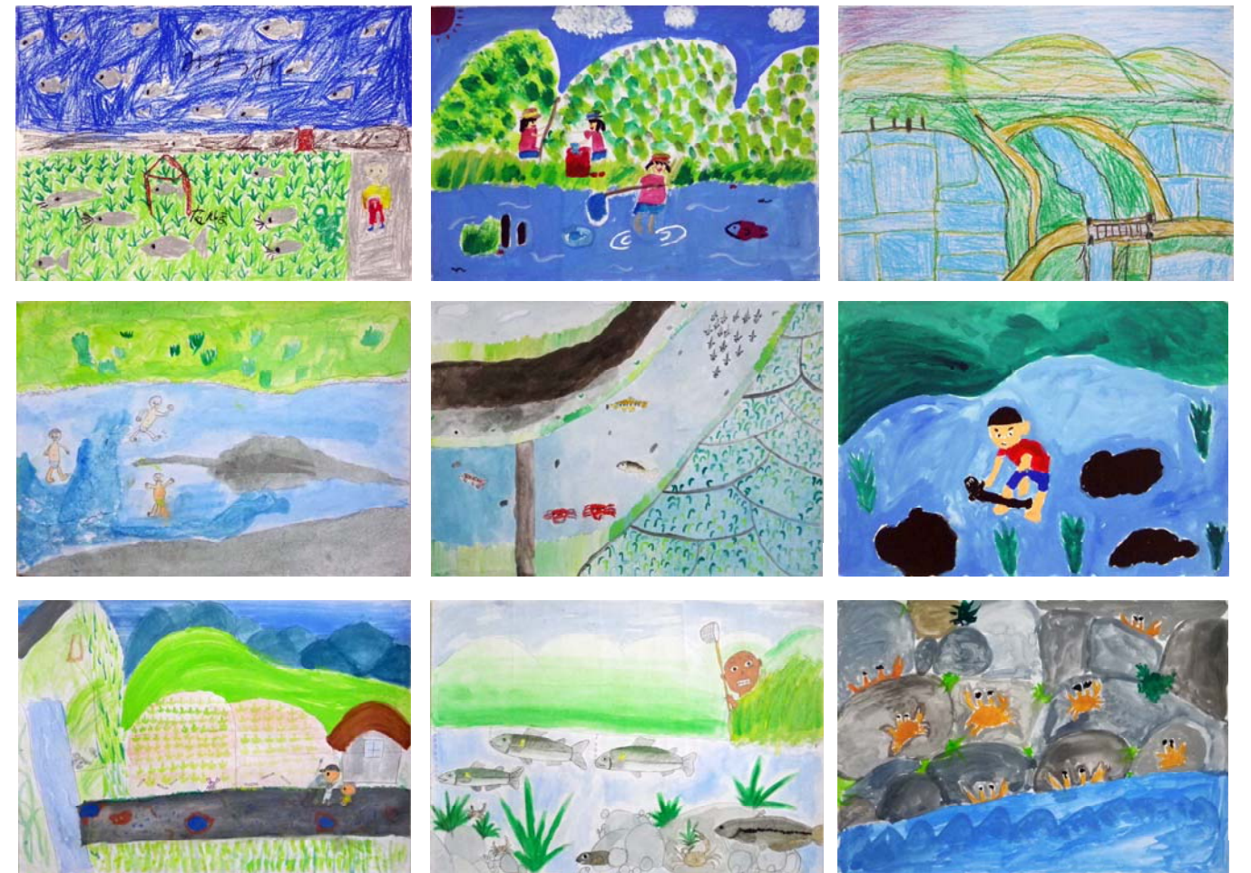
昔の水辺の風景画応募作品