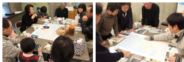
水辺での体験について語り合う参加者