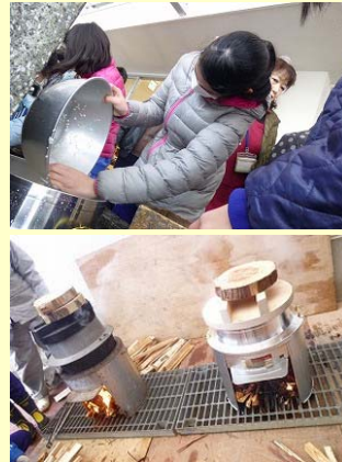
「ごはん塾」の様子

環境保全型農業研修会は、農業生産法人 上中農楽舎において開かれ、人と自然に優しい農法の技術向上を目指し、有機肥料試作研修がおこなわれました。