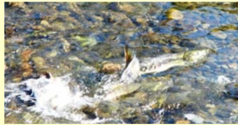
はす川を遡上するサケ

初めに三方青年の家でサケの生態や母川回帰について学び、その後、はす川中流域にて、遡上するサケを探し、観察しました。現地では、サケは人間を見つけると驚いて逃げることや、川底を掘ったり堰を跳び越えたりすることを学びました。何度か場所を変え、数や行動を記録しながら、約50匹のサケを観察しました。