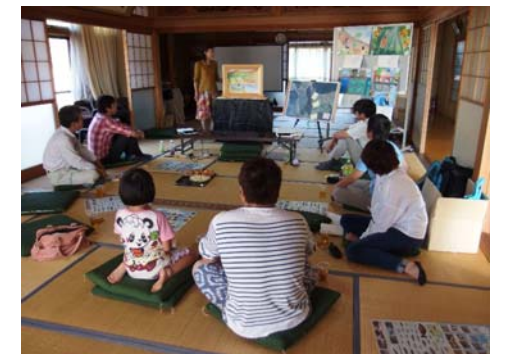
地元語り手のお話し

「五湖のめぐみワークショップ」は、三方五湖からの豊かなめぐみを地域の人々で思い起こすことを目的に開催するものです。三方五湖自然再生協議会の6つの部会の一つ、環境教育部会が中心になり、今年度から実施しています。今年度は、久々子湖と三方湖のそれぞれに隣接する集落で実施することとなりました。ワークショップでは、「昔の水辺の風景画」を眺めながら、ときに湖からの「めぐみ」をつまみながら、みんなで楽しく一昔前の地域の様子を語り合います。