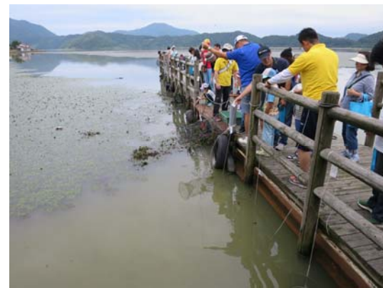
ブルーギル駆除体験

続く9月22日（木・祝）には、第2回自然再生体験ツアーを三方湖で開催しました。三方湖でのツアーは、特産の手長エビたちを狙う外来魚などの駆除を体験するものです。当日は、三方湖の湖岸で、地元漁師さんから三方湖の伝統漁法である柴漬け漁を見学させていただいたのち、若狭高校の生徒さんから三方湖の外来魚のお話を聞き、皆でブルーギル・セイタカアワダチソウなどの外来種駆除を実施しました。最後は手長エビの佃煮をおいしくいただきました。