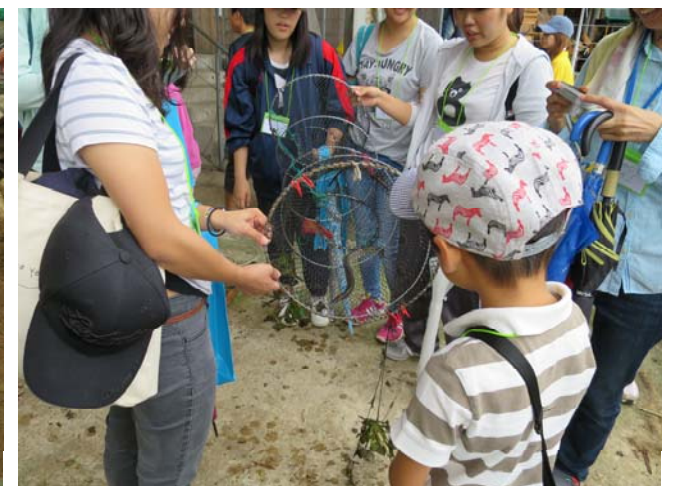
自然再生体験ツアーの様子