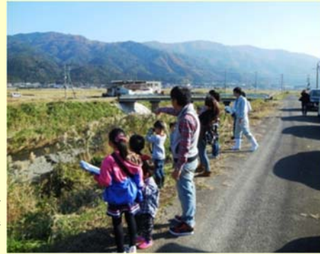
遡上するサケを観察する参加者