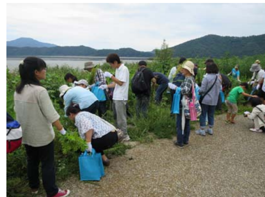
セイタカアワダチソウ駆除