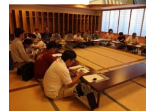
室内での意見交換