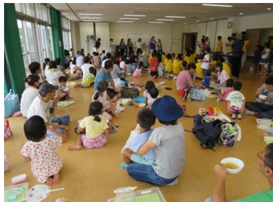
ミュージカルを見ながらシジミ汁試食