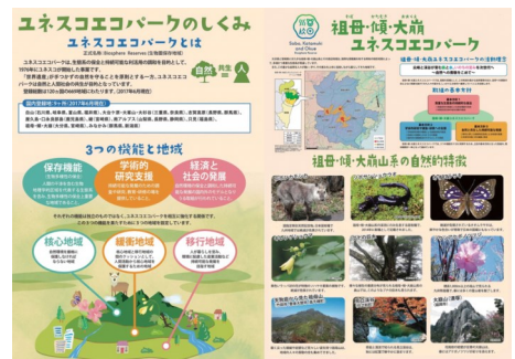
ガイドブック エコパーク関連