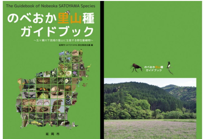
ガイドブック 表表紙・裏表紙

本市は工業都市でありながら、全国でもトップクラスの水質を誇る五ヶ瀬川をはじめとした多くの清流と、ユネスコエコパークの核となる雄大な山々、さらには海水浴場100選海の部特選に選ばれた下阿蘇ビーチなど豊かな自然にも恵まれております。ぜひ一度足をお運びください。