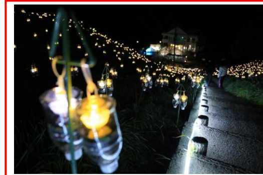
イルミネーションイベント「水仙岬のかかやき」 H28.3.13～H28.5.8 開催 水仙畑にイルミネーションを設置[H27～]