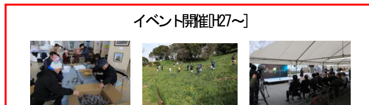
イベント開催[H27～] 「水仙岬のかかやき」準備、オープニングイベント