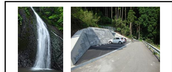
貧谷の滝周辺の整備[H26] ・駐車場、遊歩道整備、看板設置