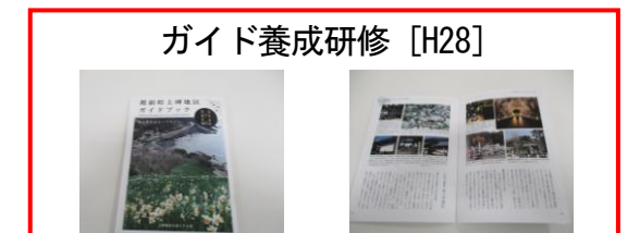
ガイド養成研修 [H28] ガイドブックを活用した 地元住民によるボランティアガイドの養成