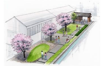
④ 湊座奥の倉庫 → 映像上映・展示・交流スペース [H27]