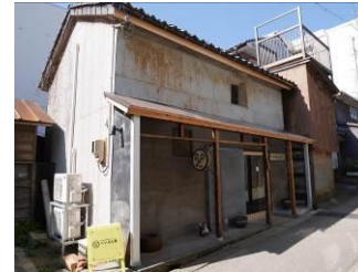
① 工房・ショップ等に改修 [H26]