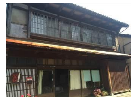
⑤ 公募物件 [H27]