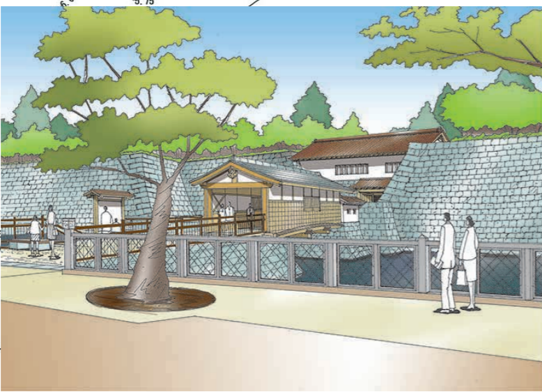
山里口御門復元整備イメージ (県都デザイン戦略 平成 25 年 3 月)