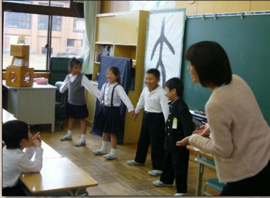
白川文字学を活用した楽しい漢字学習の授業