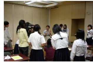
女子高校生のための科学・技術者

男女共同参画と生涯学習センターの機能を兼ね備えた複合施設として、各種の学習や講座、研修、講演に対応した施設・設備を備えています。