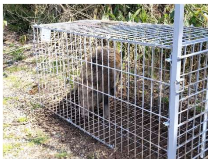
【野生イノシシの捕獲】