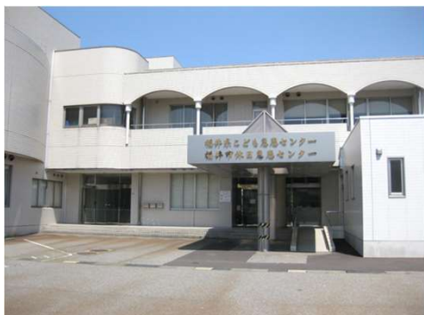
【こども急患センター（福井市城東）】