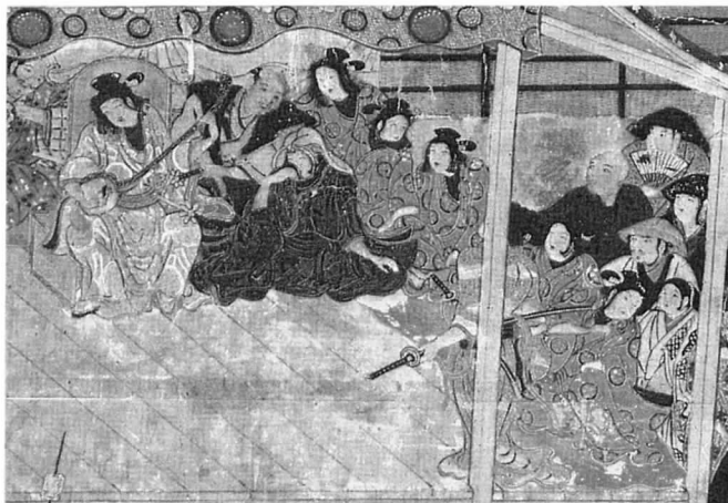
四条河原遊楽図屏風(部分) 愛知県天桂院蔵 愛知県指定文化財