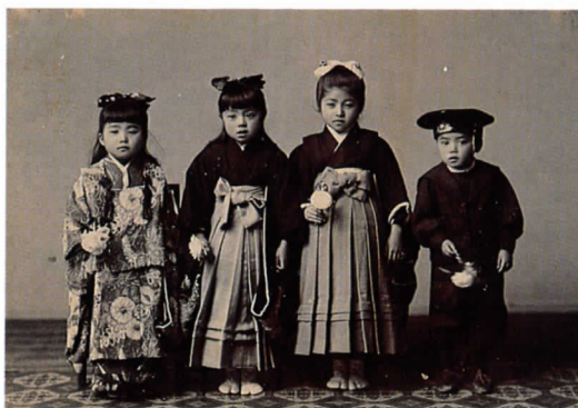
④小学進級記念（写真） [大正3年(1914)]