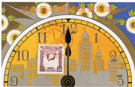
②国勢調査記念（絵はがき） [昭和5年(1930)]