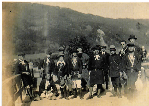
③織物工場の慰安会（写真） [大正末～昭和初期]