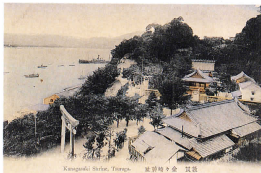
①敦賀金ヶ崎神社（彩色写真絵はがき） [明治末～大正期]

なにげない一枚の写真が、当時の政治や社会の状況を如実に物語る貴重な歴史資料になることがあります。