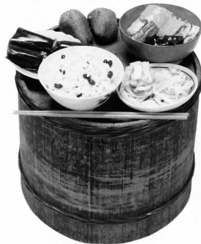
コヤアガリのウブメシ 三方町世久見

われましたが、そのときに台所の神棚の下に、写真のようなコヤアガリのウブメシ(産飯)という、ウブノカミサン(お産の神様)へのお供え物をしました。これは昭和13年に男子を出産した大正4年生れの婦人の話をもとに復元したのですが、小豆飯、ナマス、煮物、昆布巻といった料理と、ウブノカミ