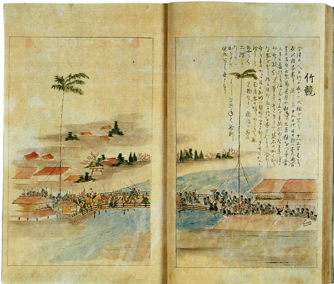
竹競べ図(「越前国名蹟考」より)