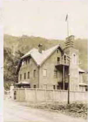
ソビエト連邦敦賀領事館