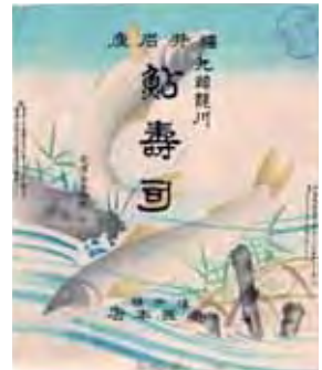
戦前の福井駅駅弁掛紙

北陸本線を背骨とすると、そこから肋骨のように伸びる私鉄が福井には多数ありました。残念ながら、その多くは現在では廃線となってしまい見ることはできません。県内に細かく張り巡らされていた私鉄の鉄道網についてご紹介します。