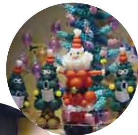
バルーン クリスマスデコレーション