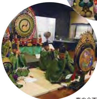
春の企画展ライブ演奏