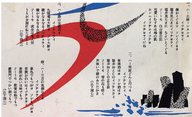
「イッチョライ節」の歌詞