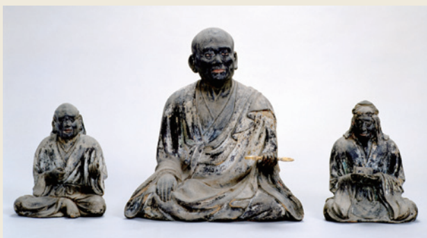
重文 泰澄および二行者坐像 (大谷寺旧蔵 文化庁蔵)

泰澄の誕生から没年まで編年体で克明に記述されている書物が『泰澄和尚伝記』です。この伝記によると泰澄は、天武11年(682)、現在の福井市浅水町で生まれ、持統9年(695)頃から越知山に入り修行をはじめ、やがて白山神の導きにより養老元年、九頭竜川畔から伊野(現勝山市猪野)を経て白山頂へと赴きました。以後白山中にて修行の日々を過ごしたようですが、その高い験力により養老6年(722)、元正天皇の病氣平癒のため奈良の都へと向かいました。死期の近づいた泰澄は、白山での日々を終え、天平宝字2年(758)、若い頃修行に励んだ越知山に再び戻り、ここで最後の時を迎えました。以上のような生涯のエピソードに、年紀と彼の年齢が付き、さらに天皇や道昭、行基、玄昉など奈良時代の豪華キャストがきら星のごとく次々と登場し、同時代の公式史書である『続日本紀』と齟齬がない点も一層真実味を増して読者にインパクトを与える小さな大河ドラマといえるでしょう。このコーナーでは越知神社本『泰澄和尚伝記』全編をご覧いただき、泰澄の生涯をみていきます。泰澄の肖像として最もよく知られる泰澄および二行者坐像(文化庁蔵(大谷寺旧蔵))をご覧いただきます。今回は特に、華やかな彩色の残る像の背面も含め、本像の魅力に触れていただきたいと思います。さらに幼少の泰澄