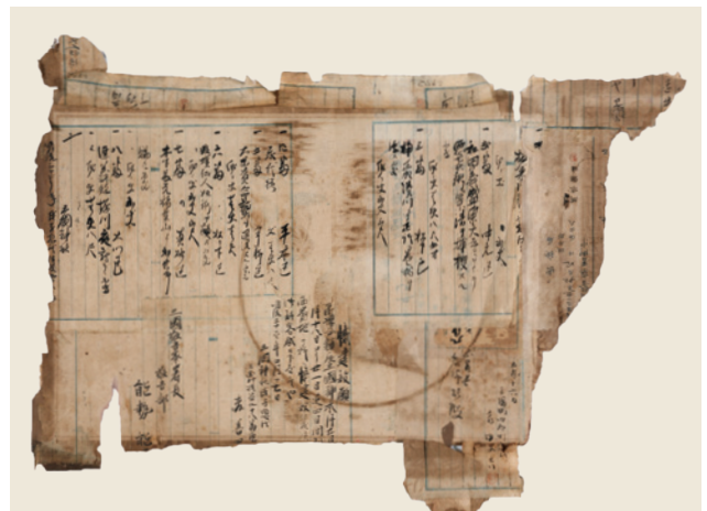
写真2 三国警察署文書(断簡)