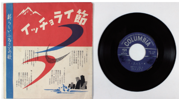
「イッチョライ節」のレコード盤とジャケット