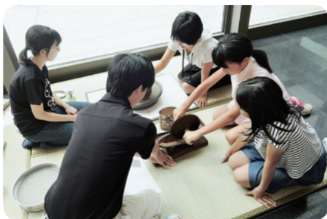
体験会「薬研を使ってみよう!」(8月6日)