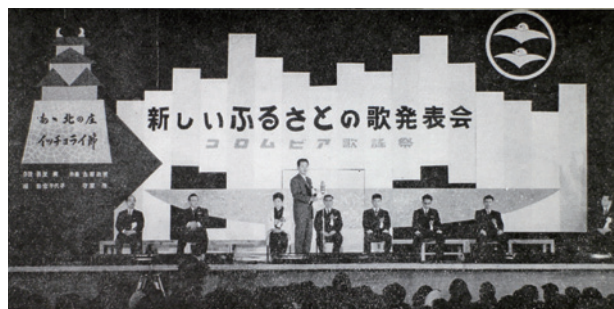
「新しいふるさとの歌発表会」(於福井市体育館 昭和37年3月18日)