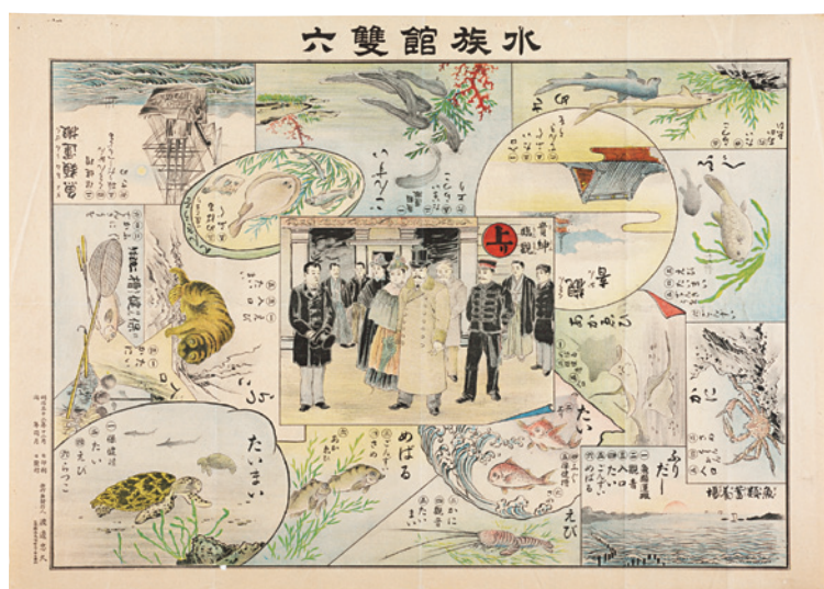
「水族館雙六」明治32年(1899)発行 縦52.3×横73.6 (cm)

なぜ、こうしたマスが設定されたのか。その点を考える前に、まず、この雙六が発行された明治32年当時の水族館の状況について振り返ってみましょう。じつは、