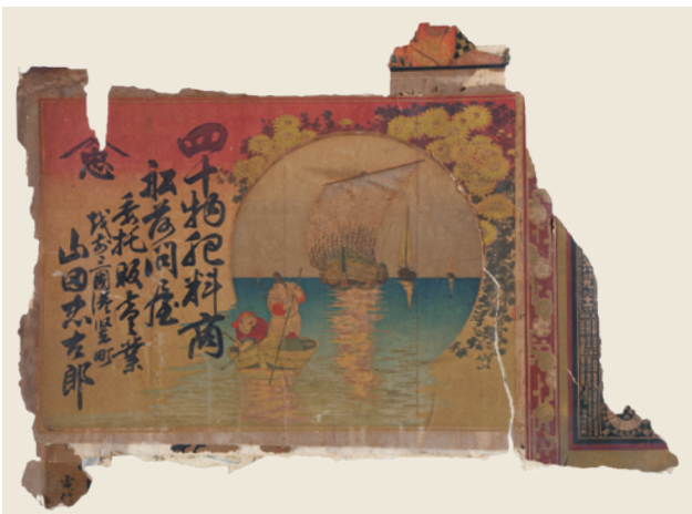
写真1 引き札「四十物肥料商 船前問屋 委託販売業 越前三国港堅町 山田忠太郎」