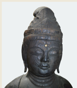
奥文 聖観音菩薩立像(部分) (平泉寺辻観音堂蔵)

越知山がライバル視した白山中宮・平泉寺について取り上げます。平泉寺(現白山神社)は白山へと向かう越前側の拠点(越前馬場)として君臨しました。現在も境内に残る御手洗池が『泰澄和尚伝記』にみえる「平清水」として、ここに淵源を求められますが、白山が都にまで知られるようになった平安時代には相応の規模