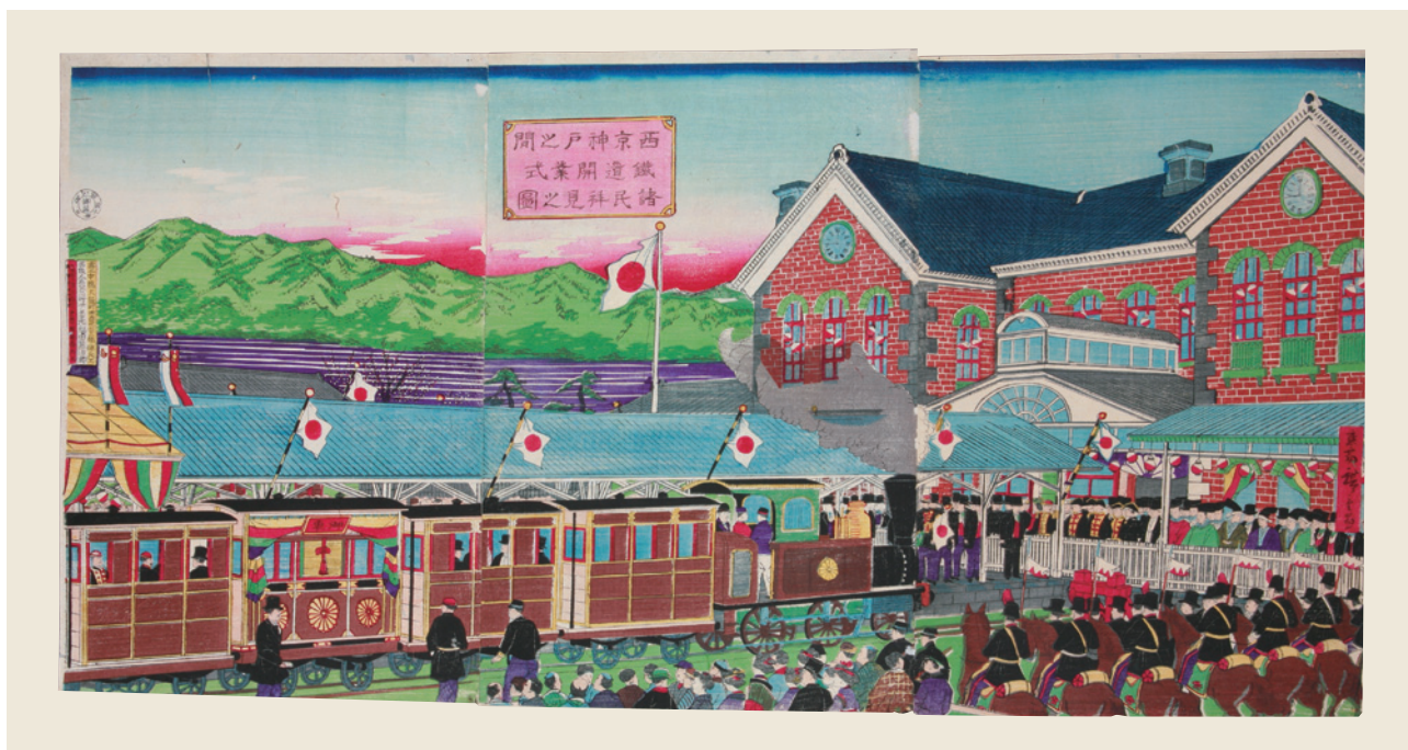
西京神戸之間鉄道開業式諸民拝見之図