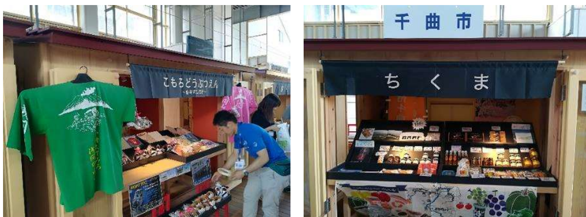
地元産品の販売ブース、周辺の観光案内（しなの鉄道 軽井沢駅）