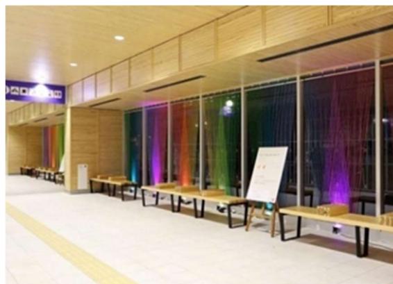
えちぜん鉄道福井駅での展示 (福井工業大学)