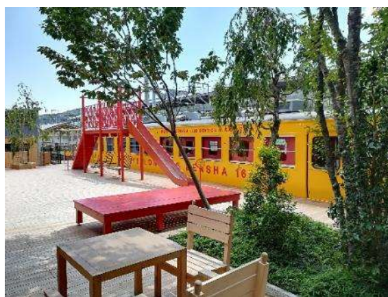
キッズスペース（しなの鉄道 軽井沢駅）