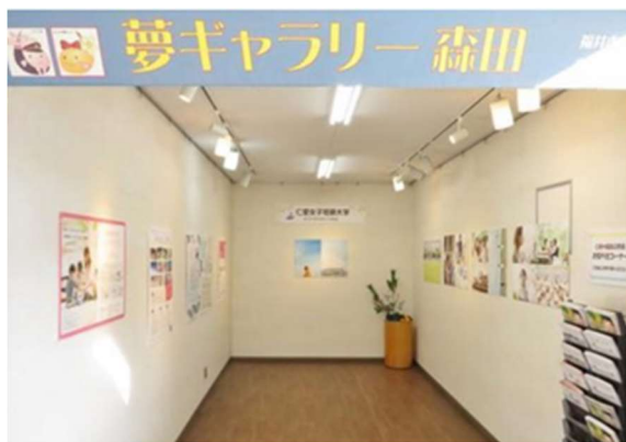
森田駅ギャラリースペースでの展示 (仁愛女子短期大学)

さらには、産学連携の一環として、県内大学等と連携し、鉄道を利用した学びの場の提供や利用促進策の共同企画（駅舎デザインや改修等）など、将来の利用者となりうる学生をターゲットとした取組みも検討する。