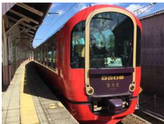
えちごトキめきリゾート雪月花 (えちごトキめき鉄道)