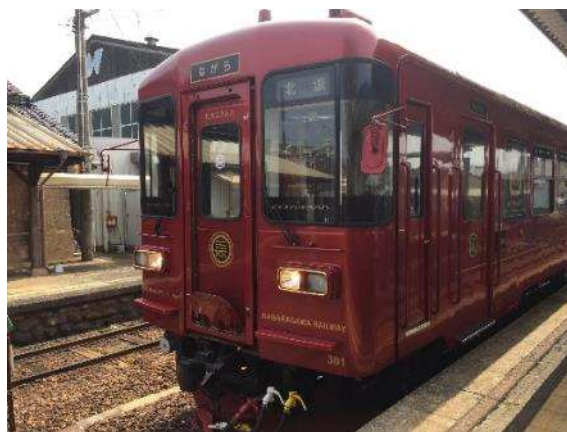
観光列車「ながら」 (長良川鉄道)