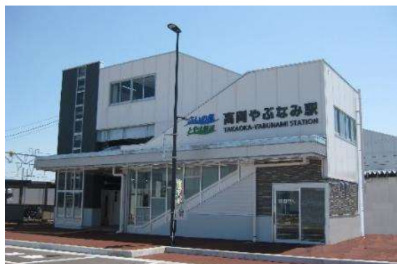
高岡やぶなみ駅（あいの風とやま鉄道）