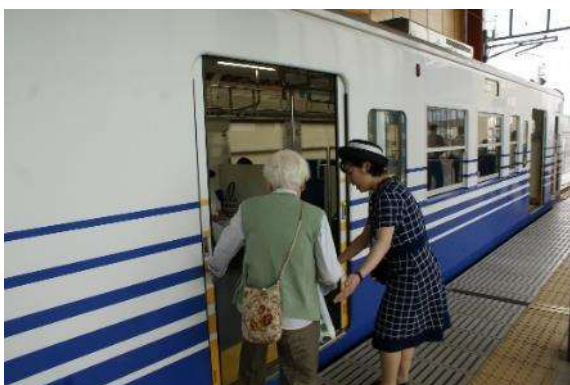
高齢者等の乗降補助（えちぜん鉄道）