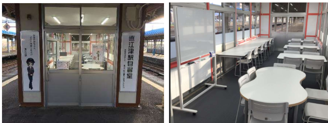
学生向け自習室（えちごトキめき鉄道 直江津駅）