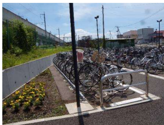
駐輪場の新設 (IGRいわて銀河鉄道 厨川駅)