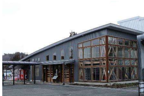
巢子駅（IGRいわて銀河鉄道）