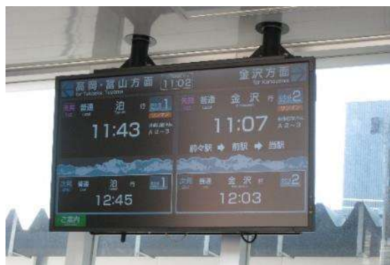
運行状況表示ディスプレイ（あいの風とやま鉄道）