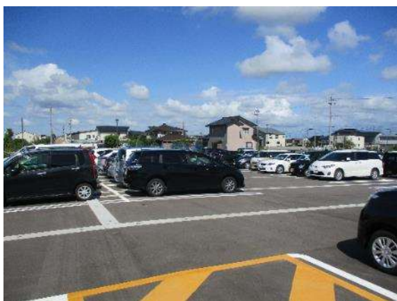
パーク&ライド駐車場の新設 (あいの風とやま鉄道 石動駅)