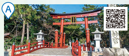
敦賀市內的觀光景點