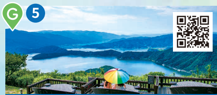
彩虹之路山頂公園

釀造味道醇厚,綿長回甘的本地特產「早瀨浦」清酒,在店面有銷售。(不提供參觀酒廠服務)