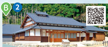
若狹國古城歷史資料館

介紹日本百大名城「佐佐木國古城」等的資料館。有通往城堡遺跡(山頂)的登山道。在②號巴士站下車 步行10分鐘。