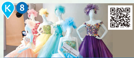
婚紗博物館(Yumi Katsura Museum Wakasa)