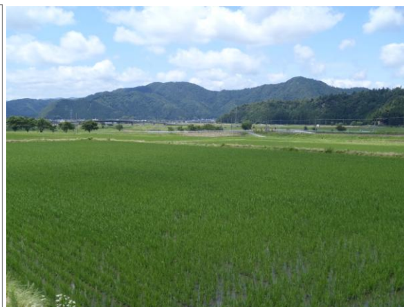
取組区の水田（若狭町）