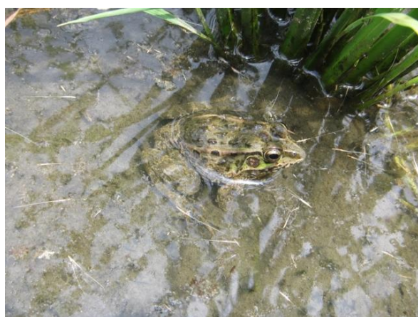
取組区の水田で確認されたダルマガエル

中干延期の取組区分について、取組区と標準区を比較すると、水生昆虫類の種類数及び個体数、カエル類の個体数について、取組区のほうが多くなる傾向が認められた。また、若狭町の取組区では県域絶滅危惧Ⅱ類に指定されている重要種のダルマガエルが確認された。