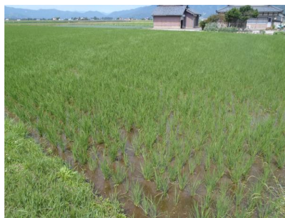
取組区の水田（大野市）