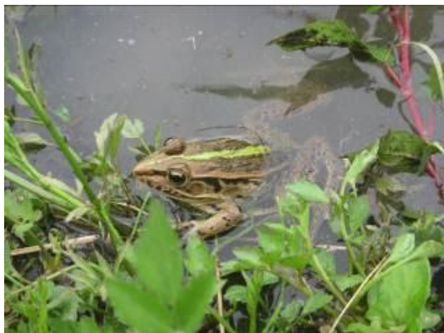
取組区の水田で確認されたトノサマガエル