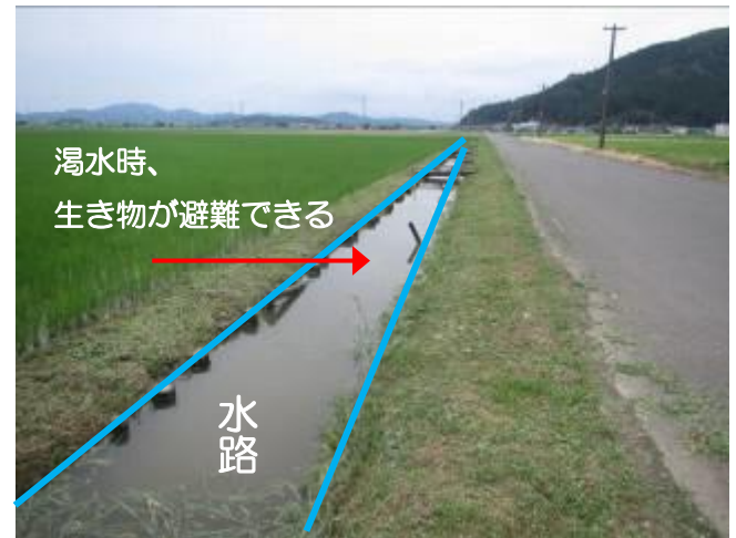
生き物緩衝地帯の水路と水田（鯖江市）

生き物緩衝地帯の取組区分において、水生昆虫類は、種類数・個体数ともに取組区で多く確認された。カエル類についても、取組区の方が標準区より種類数・個体数ともに多かった。 多様度指数についても、水生昆虫類・カエル類ともに取組区で高い結果となった。 取組区には、写真のような水路が設置されているので、渇水時に生き物の避難場所になると考えられる。