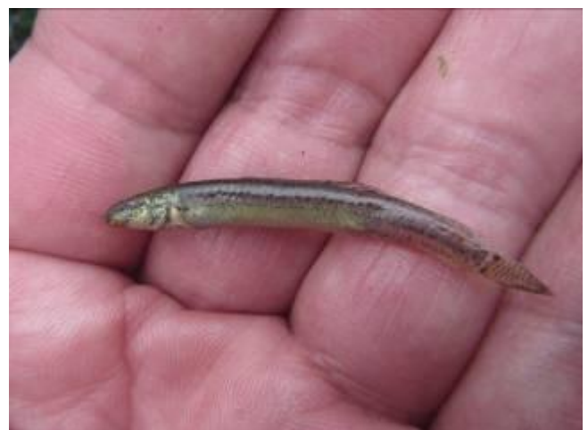
取組区の水田で確認されたドジョウ