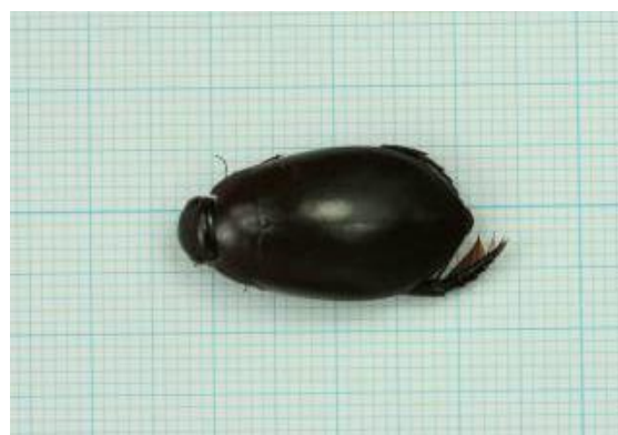
取組区の水田で確認されたクロゲンゴロウ