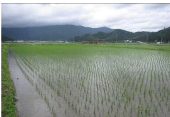
取組区の水田 (若狭町)

冬期湛水の取組区分について、取組区と標準区を比較すると、水生昆虫類の種類数、カエル類の種類数と個体数について取組区のほうが多くなる傾向が認められた。 また、多様度指数は水生昆虫類については取組区のほうが高い結果となった。