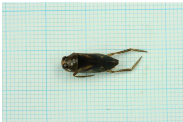
取組区の水田で確認されたマツモムシ

冬期湛水の取組区分について、取組区と標準区を比較すると、水生昆虫類の種類数、カエル類の種類数と個体数について取組区のほうが多くなる傾向が認められた。 また、多様度指数は水生昆虫類については取組区のほうが高い結果となった。