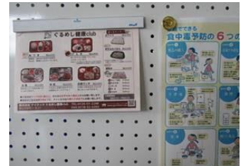
（健康に配慮した飲食物提案）