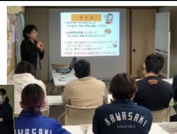
（セミナー開催風景）