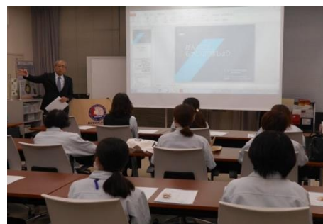
（↑セミナー開催風景）