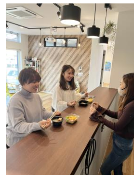
（設置型社食で コミュニケーション）