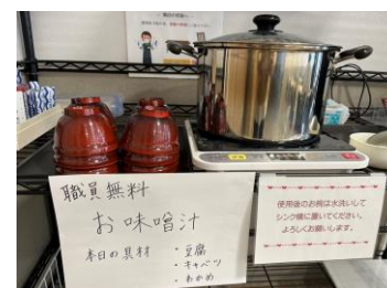
（味噌汁の無料提供）