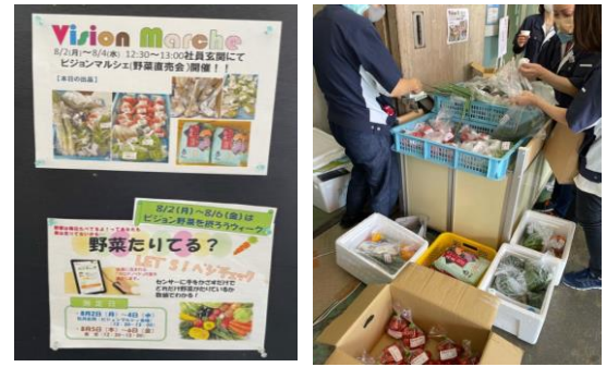
(ビジョンマルシェ)