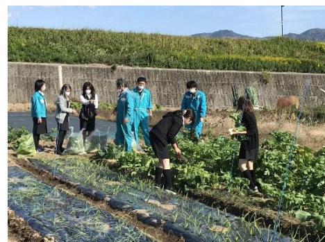
（↑クボタふれあい菜園）