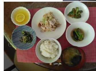
（県産農産物を使用した社食）