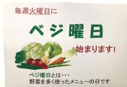
（社食に掲示しているベジ曜日のポスターと実際のメニュー）