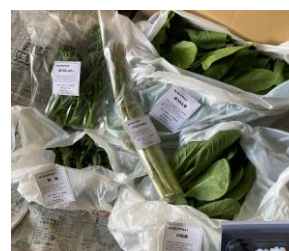
←季節の 野菜セット