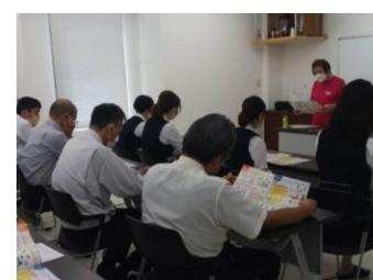
(食生活改善講習会の様子)