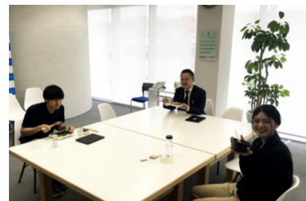
（シャッフルランチ）