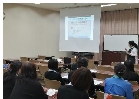
（野菜ソムリエプロによる講演）