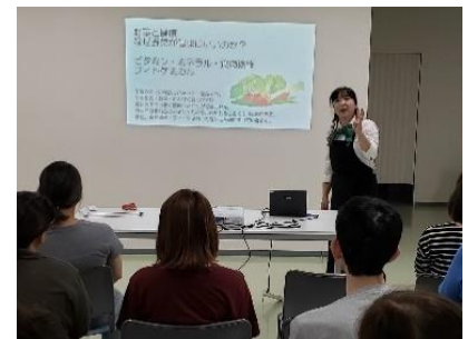
（野菜ソムリエプロによる講演）