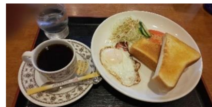
(↑モーニングセット)