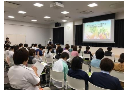
（野菜ソムリエプロによる講演）