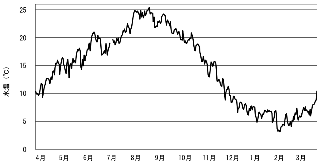
図3 新飼育棟における使用河川水の水温（令和6年4月～令和7年3月）