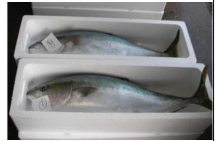
写真：市場に水揚げされたブリ (宮田、鮎川)

12月前半(1~15日)の定置網漁業におけるブリ(2歳魚以上)の水揚量は、速報で34.7t(2010年:69.7t、2009年:0.5t、2008年:3.9t、2007年:3.1t)となっています。特に水揚の多かった昨年と比較するとおよそ半分と少ないですが、例年(2010年を除く)の同時期と比較すると大きく上回っていることから好調であると思われます。隣府県でも、平年(2010年を除く)並みの漁獲があるようです。今年度は、年明けも操業する定置網がいくつかあるようですし、大漁を期待したいところです。