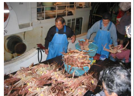
写真：ズワイガニ水揚げ風景