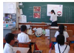
〈郷土料理給食献立考案〉