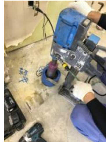
コアボーリング装置