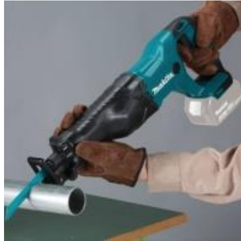
レシプロソー（セーバーソー）