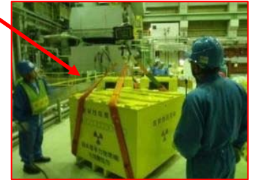
鉄箱作製状況 (写真は重量測定)