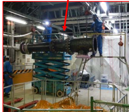
配管吊り降ろし状況 踏み台、リフターを使用