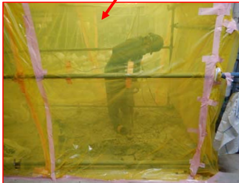
基礎斫り状況 粉じん拡散防止用ハウスを設置