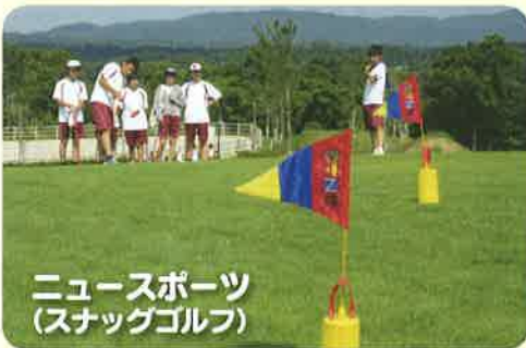
ニュースポーツ (スナッグゴルフ)