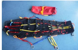
パーティカルストレッチャー