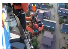
令和4年8月 南越前町豪雨災害