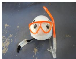
ヘルメット・シュノーケル