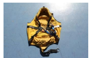
エバックハーネス