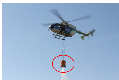
消火バケツ(容水量600ℓ)