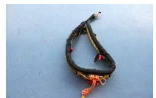
サバイバースリング