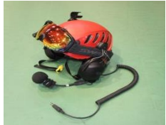
航空救助用ヘルメット