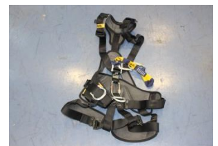
フルボディハーネス