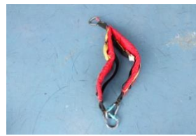
レスキュースリング