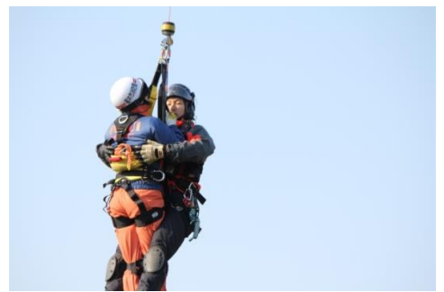
サバイバースリング