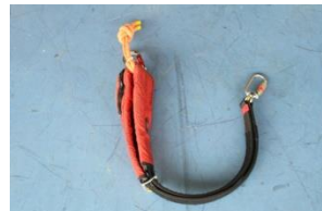
クイックストラップ