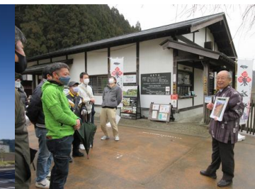
朝倉氏遺跡保存協会