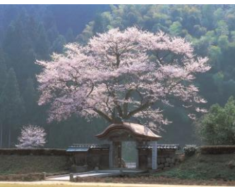
一乗谷朝倉氏遺跡 唐門