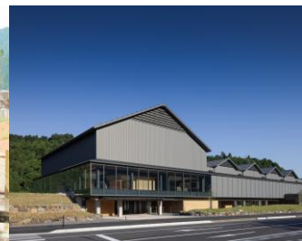
一乗谷朝倉氏遺跡博物館