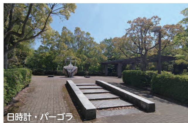
日時計・パーゴラ