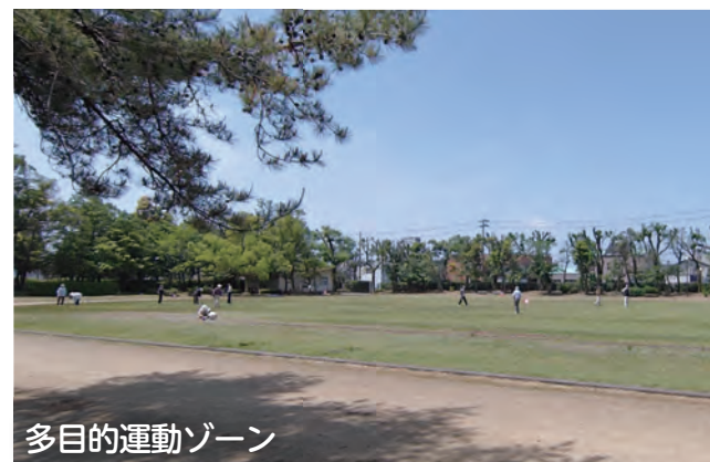
多目的運動ゾーン

ご回答は統計にのみ利用し、個人が特定されることはありません。ご協力をお願いいたします。