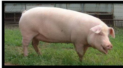
ふくいポーク母豚(LW)種:メス