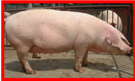
ランドレース(L)種:メス (子沢山で子育て上手)

畜産試験場では、ふくいポークの父親と母親になる2種類の豚を生産して県内農家に供給しています。