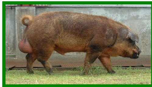
ふくいポーク父豚・デュロック(D)種:オス (肉質に優れている)