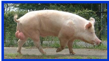
大ヨークシャー(W)種:オス (丈夫でお肉たっぷり)