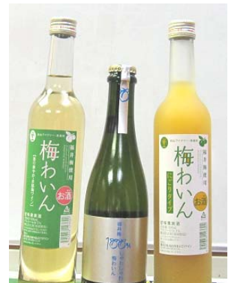
クリア スパークリング にごり