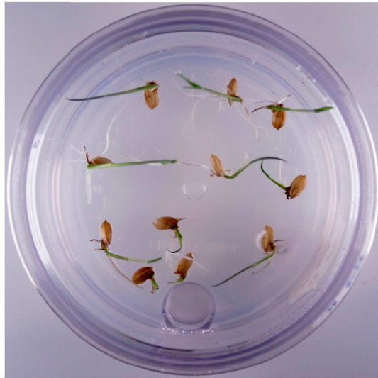
抗菌微生物処理をした後に発芽した種子 (雑菌は検出されなかった)