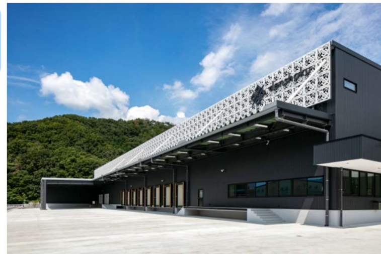
(株)伝食 伝食ロジスティクス(R5年度新設)