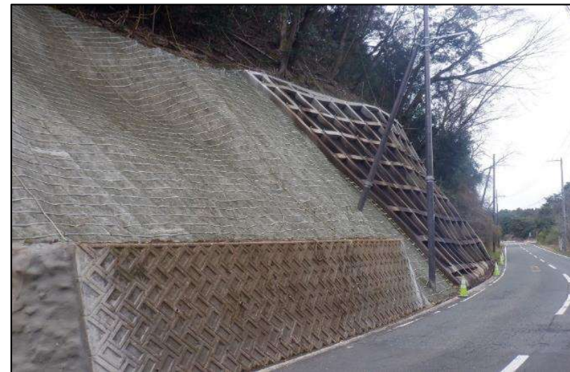
法面对策のイメージ (主要地方道 舞鶴野原港高浜線)

避難道路の代替道路がなく、土砂災害等により寸断される可能性がある主要道路(県道・市道)に対して、法面对策工事等を実施しました。