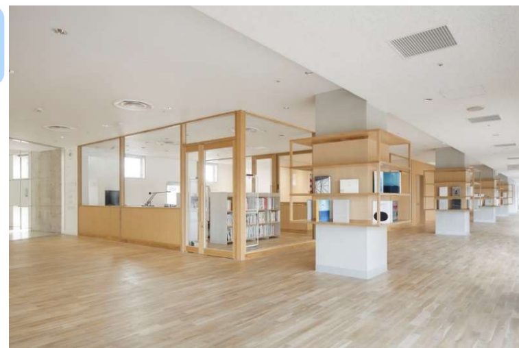
デザインセンターふくい デザインに関する相談や、試作の支援等を実施

サンドーム福井に、商品の展示・販売に活用できるエリアや幅広い層の県民がものづくりに活用できるラボなどを整備し、企業による新商品開発やものづくり人材の育成を支援します。