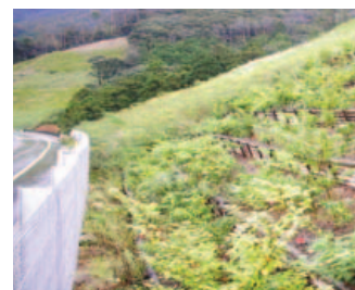
本来の自然植生の復元をめざした緑化 (国道162号・小浜市)