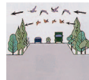
植樹によって野鳥の飛行コースを妨げない工夫を凝らした道づくり