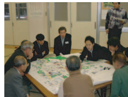
住民とのワークショップ(大野市)