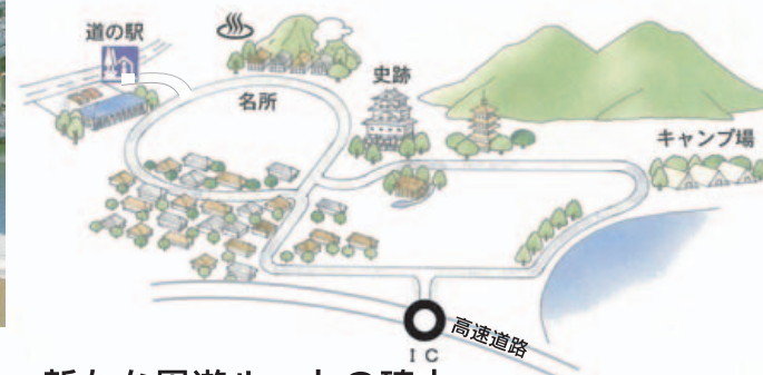
新たな周遊ルートの確立