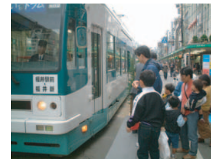
トランジットモールの実験(福井市)