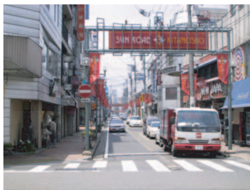
整備前 (福井市サンロード北の庄)