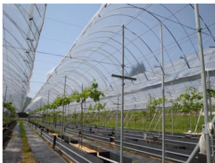
アーチ部分の内側