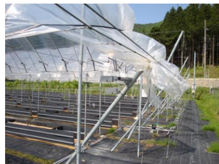
果樹棚のアンカー部分