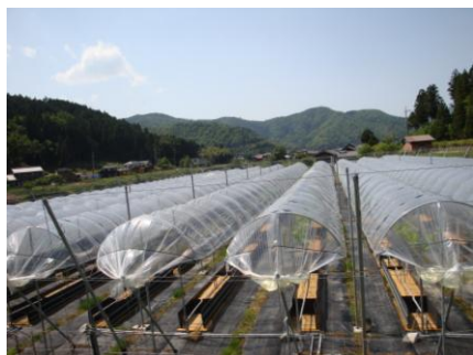
トンネル状の雨よけ施設