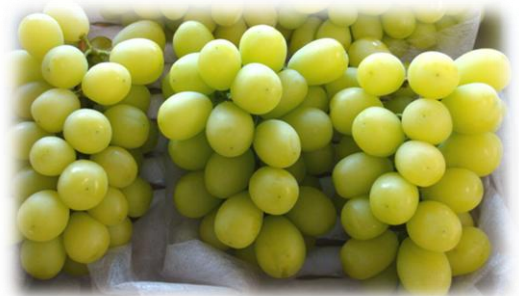
収穫した果実(シャインマスカット)