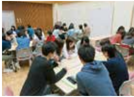
下級生ガイダンス