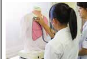
オープンキャンパス